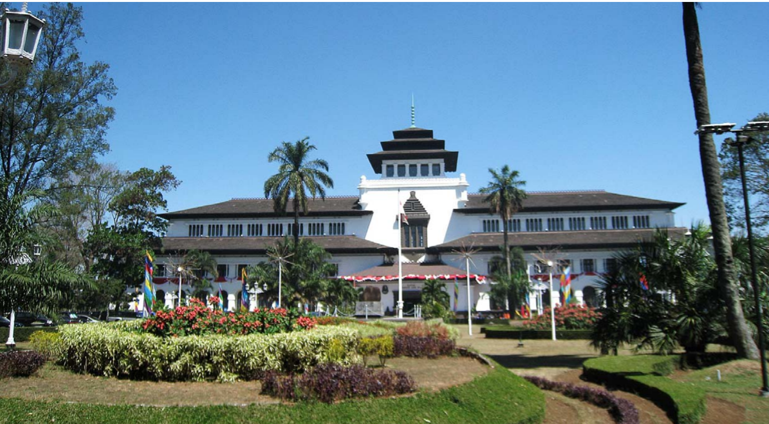
Gedung Sate : pusat pemerintahan daerah Jawa barat

Urusan pemerintahan konkuren yang menjadi kewenangan daerah terdiri atas Urusan Pemerintahan Wajib dan Urusan Pemerintahan Pilihan. Urusan Pemerintahan Wajib terdiri atas urusan pemerintahan yang berkaitan dengan pelayanan dasar dan urusan pemerintahan yang tidak berkaitan dengan pelayanan dasar. Perbedaan antara ketiga urusan pemerintahan dapat dilihat dalam tabel berikut.