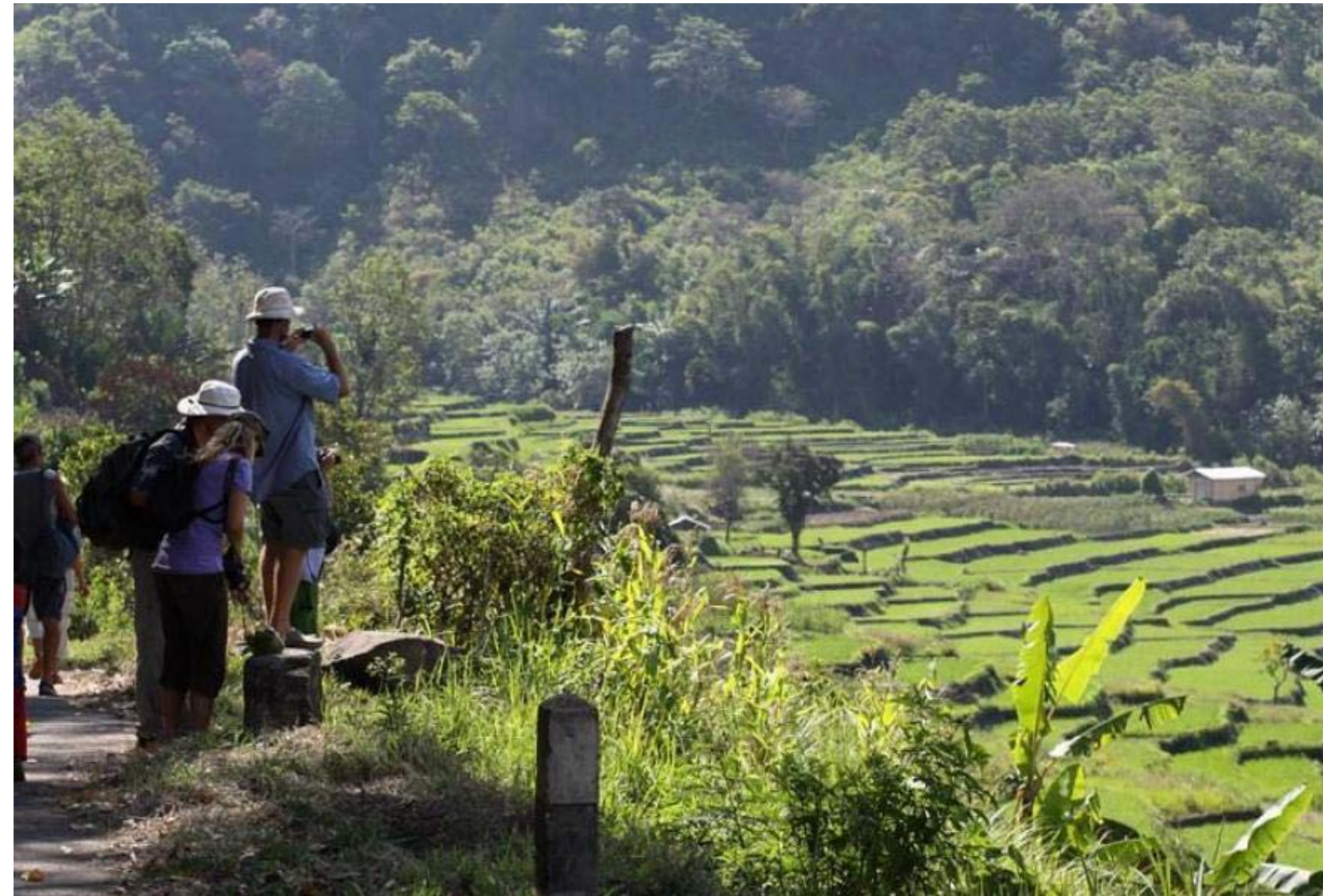
Gambar 4.1 Agrowisata Waturaka

Desa Waturaka, Ende yang meraih desa wisata alam nasional terbaik ( https://elshinta.com/news , Diunduh Tanggal 27 Desember 2017) dapat dilihat dalam gambar di bawah ini.