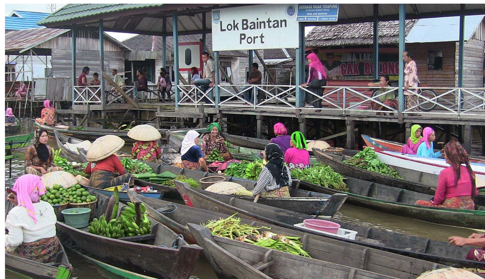
Gambar 4.3 Pemanfaatan Daerah Aliran Sungai Untuk Pasar Apung Lok Baintan, Banjarmasin

adalah Pasar Apung Lok Baintan, Banjarmasin. Pasar apung selain sebagai sarana jual beli kebutuhan sehari-hari masyarakat sekitar, juga berfungsi sebagai tempat wisata yang elok dan indah. Para penjual dan pembeli sama-sama naik perahu. Dagangan diangkut menggunakan perahu atau sampan, pembeli menghampiri penjual atau sebaliknya untuk jenis dagangan yang mau dibelinya. Dagangan yang dijualnya kebanyakan hasil kebun berupa sayur dan buah-buahan, beserta makanan khas daerah.