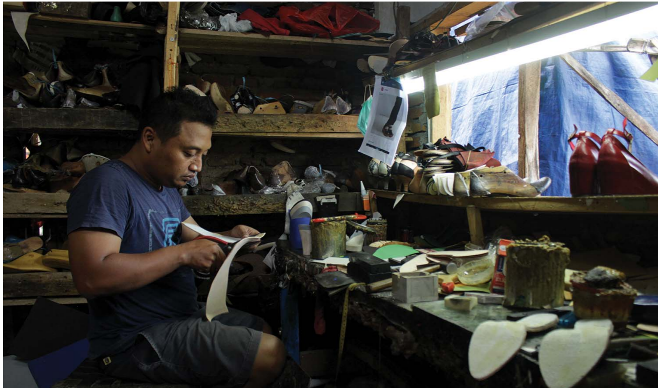
Gambar 4.4 ndustri Sepatu

terakhir Sentra Industri Boneka Sukamulya Sukajadi. Daerah-daerah lain dapat mengembangkan sentra-sentra industri yang berbeda-beda yang menggerakkan masyarakat semakin kreatif dan sejahtera.